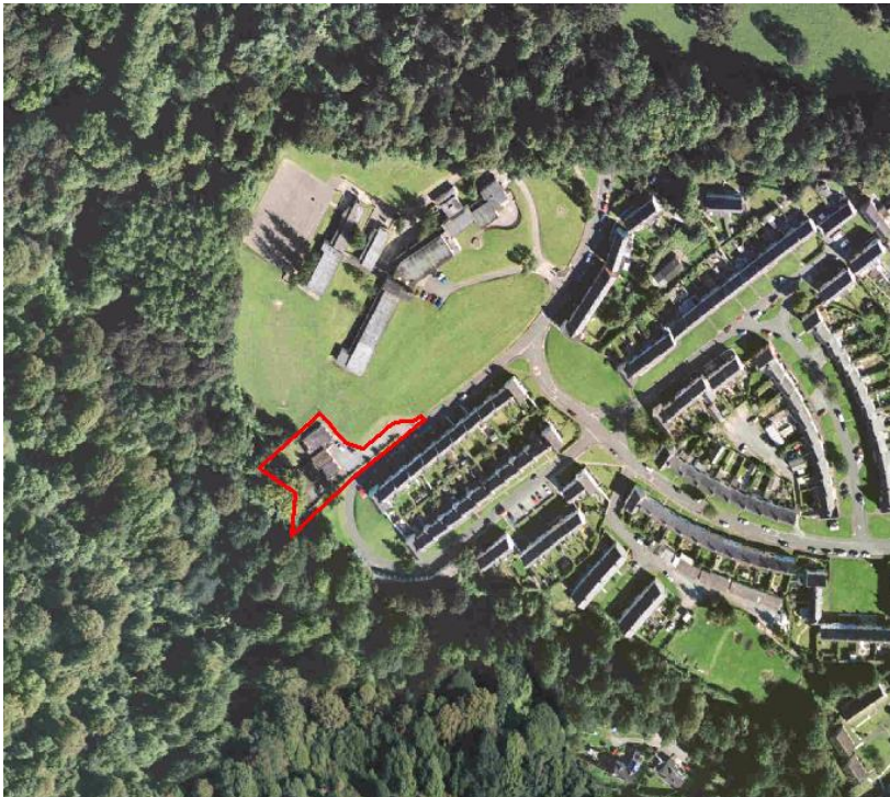
Darlun 3 – Canolfan Ofal Dydd Biwmares

Disgrifiad – Eiddo a adnabyddir fel Canolfan Ofal Dydd Biwmares sy'n ffinio ar gaeau chwarae Ysgol Biwmares. Mae'r safle'n mesur oddeutu 0.16 hectar (0.41 acer) ac mae'r adeilad yn ymestyn i 215 m 2 . Mae'r eiddo'n terfynu ar gae chwarae Ysgol Biwmares sy'n cynnig cyfle i ymestyn arwynebedd y safle er mwyn creu datblygiad mwy. Cafwyd gwybodaeth y gellid ystyried rhannu rhai gwasanaethau a chyfleusterau gyda'r Ysgol gyfagos, yn amodol ar ystyriaethau'n ymwneud â'r dyluniad arfaethedig, perchnogaeth a materion cyfreithiol.