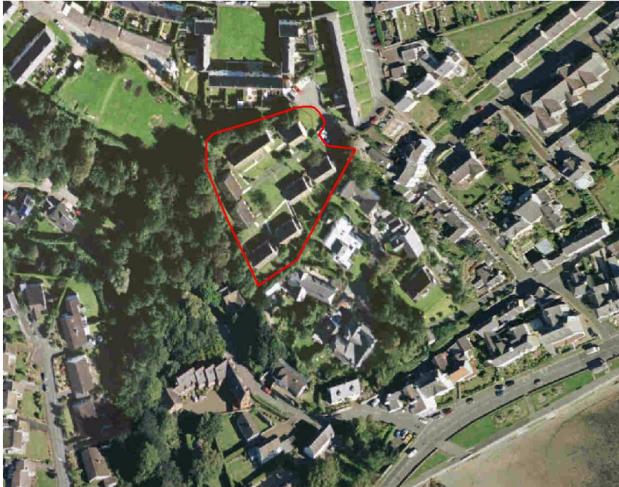
Darlun 4 - Bryn Tirion, Biwmares

Disgrifiad – Datblygiad bach o fyngalos gwarchod yr awdurdod lleol ar ffordd bengaead yw Bryn Tirion ac mae'n mesur oddeutu 0.92 hectar (2.27 acer). Mae'r safle wedi'i leoli mewn ardal breswyl sefydledig ond mae'r ffyrdd yn gul ac mae llefydd parcio yn brin. Mae pob un o'r byngalos yn cael eu dal ar gytundebau tenantiaeth ddiogel felly nid yw'r eiddo ar gael yn rhwydd i'w datblygu.