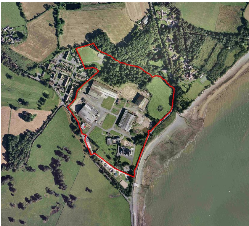
Darlun 8 – Seiriol – Lairds, Llanfaes

Disgrifiad – Safle mewn perchnogaeth breifat sy’n ymestyn i oddeutu 5.96 Hectar (14.73 Acer). Mae nifer o adeiladau diwydiannol ar y safle fyddai’n rhaid eu dymchwel ac mae’n debygol fod rhannau o’r tir wedi’i lygru.