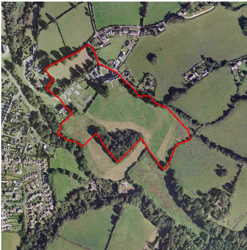
Darlun 6 - Haulfre, Llangoed

Disgrifiad – Cyfleuster cartref gofal sydd ym mherchnogaeth yr Awdurdod Lleol mewn tiroedd sy'n mesur oddeutu 8.41 hectar (20.79 acer).