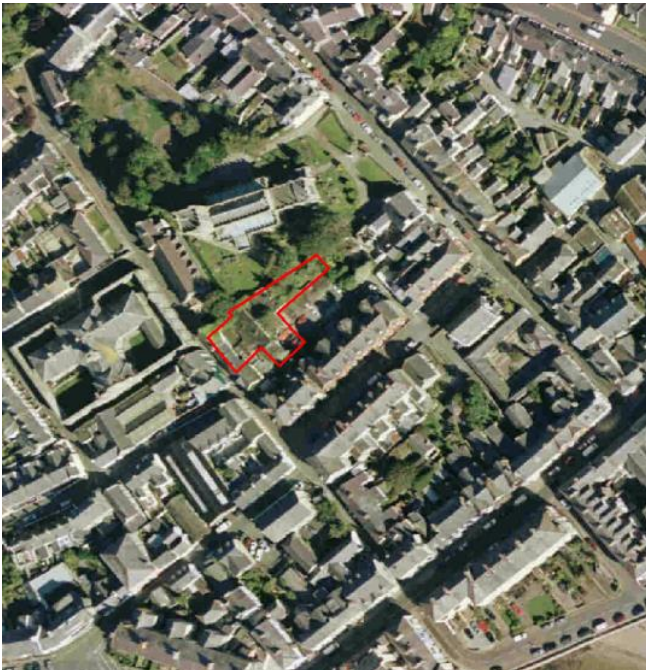
Darlun 7 – Clwb Cymdeithasol, Biwmares

Disgrifiad - Hen glwb cymdeithasol mewn perchnogaeth breifat sy'n agos i ganol tref Biwmares. 0.07 Hectar, 0.237 acer. Mae'r safle'n cynnwys 2 eiddo canol teras ynghyd â hen adeilad y clwb cymdeithasol yn y cefn. Mae mynediad yn broblem oherwydd natur y lonydd a'r garejys sydd mewn perchnogaeth breifat yng nghefn yr adeilad. Mae lle yn gyfyngedig hefyd oherwydd bod y safle yn ymyl yr Eglwys.