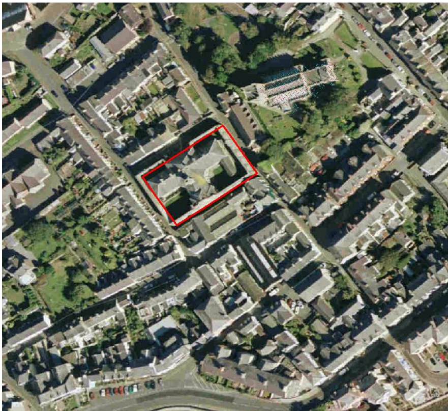
Darlun 5 – Carchar Biwmares

Disgrifiad – Adeilad hanesyddol Gradd 1 yr hen garchar wedi ei leoli yn agos at ganol tref Biwmares. Mae'r safle'n mesur oddeutu 0.17 hectar ac mae 0.42 hectar wedi ei ddatblygu'n llawn. Mae'r lonydd sy'n arwain at yr eiddo yn gul iawn ac mae prinder llwybrau cerdded.